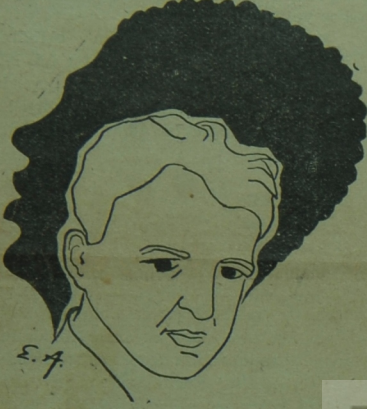
Howard Fast genç bir Amerikan yazardır. Amerikan tarihinden parçalar

Bütün gece boyunca ateş devam etti. Nihayet şafakla beraber durdu. Sessizlik içinde kahvaltılarını yaptılar. Ses sızlık içinde Jeff ufak tefek kırmızı lara «uyku deliği» masahını anlattı. Ses sızlık içinde Jeff ufak tekef kırmızı yüzü Klu- Klux - Klancı adamın ölüsüne baktı. Onun ne ismini biliyordu, ne geldiği yeri, ne de onu buraya sürükleyen yabancı eli!